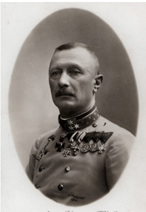
Général Oskar Potiorek (1853-1933)