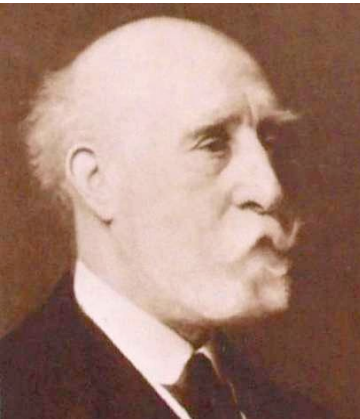
Marquis Charles Melchior de Vogüé (1829-1916)