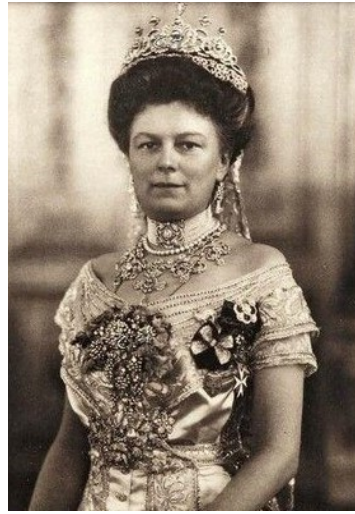
Duchesse de Hohenberg Sophie Chotek (1868-1914)