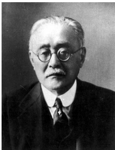
Nitobe Inazō (1862-1933) Secrétaire Général adjoint de SDN