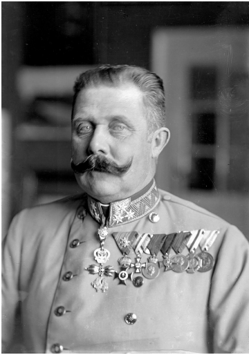
Archiduc d'Autriche-Este François-Ferdinand (1863-1914)