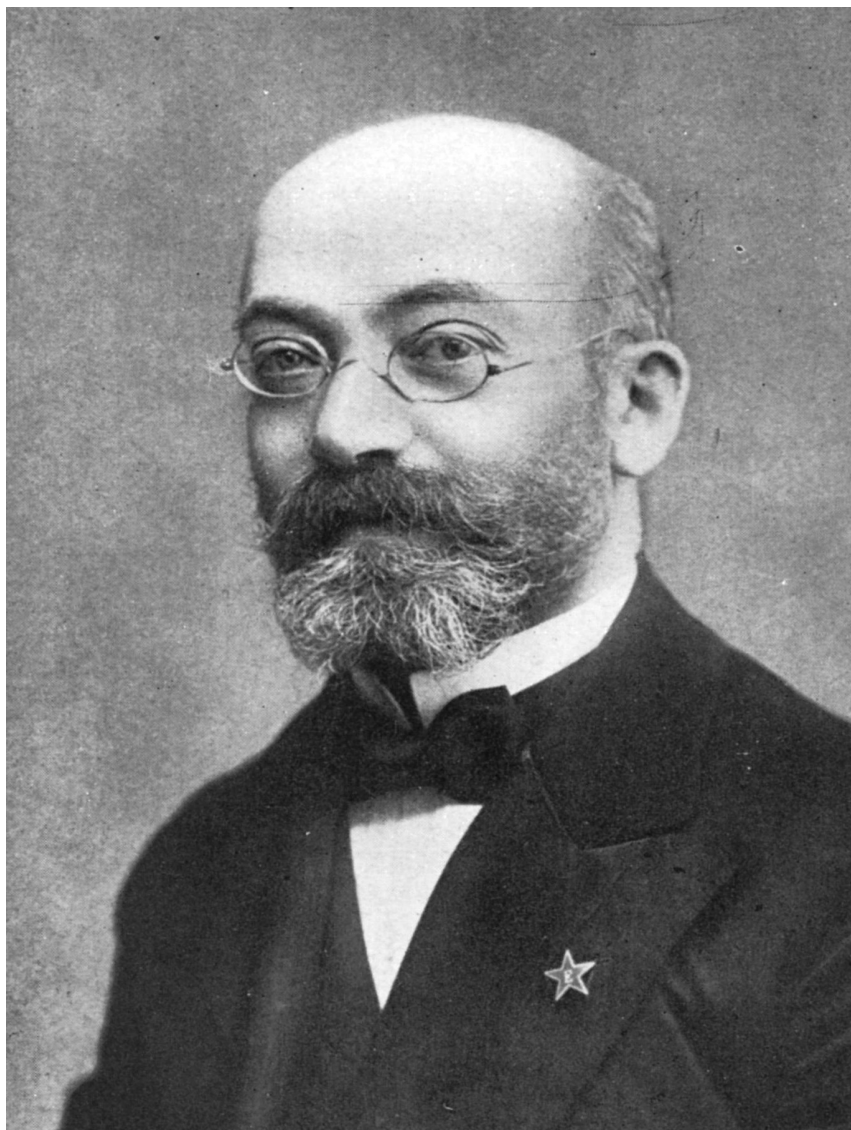
Louis Lazare Zamenhof (1859-1917) ophtalmologue polonais inventeur de l'espéranto