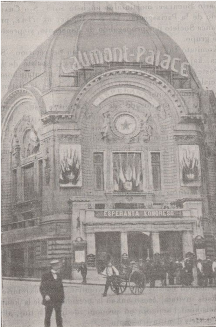
Le Gaumont-Palace accueillant le 10 e Congrès Mondial d'espéranto prévu à Paris du 2 au 9 août 1914, mais qui ne dura qu'un seul jour...