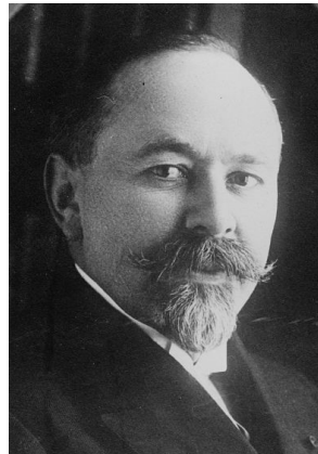
Ambassadeur Milenko Vesnić (1863-1921)